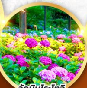
วัดมิมุโระโทจิ