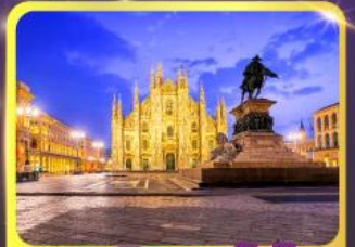
มหาวิหารคูโอโม