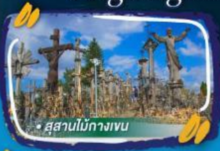
• สุสานไม้กางเขน