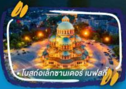
• โบสถ์อเล็กซานเดอร์ เนฟสกี