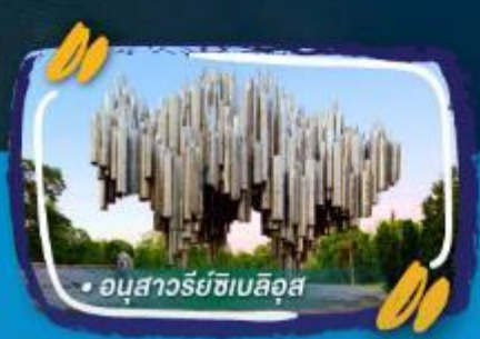
• อนุสาวรีย์ซิมลิส