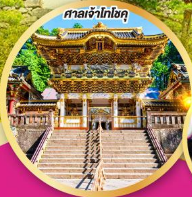
ศาลเจ้าโทโฮกุ