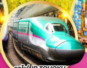
รถไฟ JR TOHOKU SHINKANSEN LINE