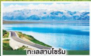
ทะเลสาบไซรัม