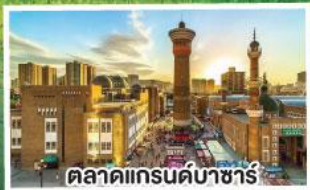
ตลาดแกรนด์บาซาร์