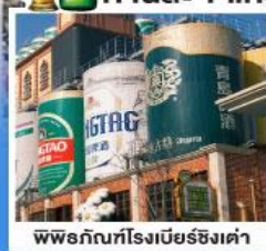
พรรณที่โรงเบียร์ชิงเต่า