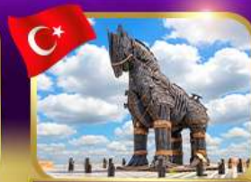
ม้าไม้เมืองทรอย ซานิคคาลั