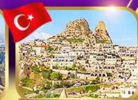
หุบเขาอูซซาร์ คัมปาโดเกีย