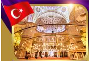
เข้าชมความงามสุเหร่าสีน้ำเงิน