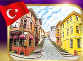
ชมบ้านหลากสีย่านบาลีก