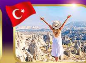
ชมความงาม หุบเขาแห่งรัก