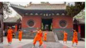
ชมโชว์กังฟูเส้าหลิน

*ทางบริษัทฯ ขอสงวนสิทธิ์ในการสลับโปรแกรมทัวร์ตามความเหมาะสมขึ้นอยู่กับสถานการณ์ประจำวัน โดยคำนึงถึงผลประโยชน์ของลูกค้าเป็นสำคัญ