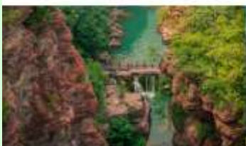
อุทยานสวรรค์หยุนโตซาน