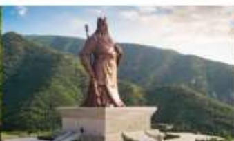
บ้านเกิดกวนอู