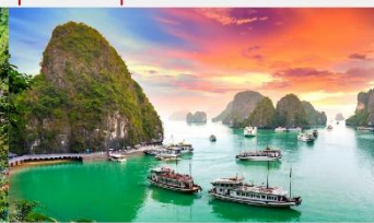
อ่าวฮาลอง

*ทางบริษัทฯ ขอสงวนสิทธิ์ในการสลับโปรแกรมทัวร์ตามความเหมาะสมขึ้นอยู่กับสถานการณ์หน้างาน โดยคำนึงถึงผลประโยชน์ของลูกค้าเป็นสำคัญ