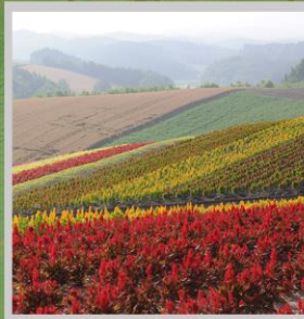
"SHIKISAI NO OKA"