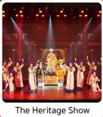
The Heritage Show