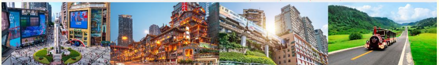
ถนนเจี๋ยฟางเป่ย์