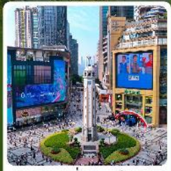
ถนนเจียฟางเป่ย์