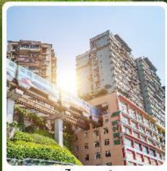
รถไฟทะเลตึก