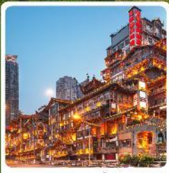
หงหยาดิง