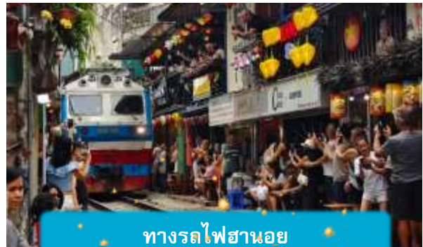
ทางรถไฟฮานอย