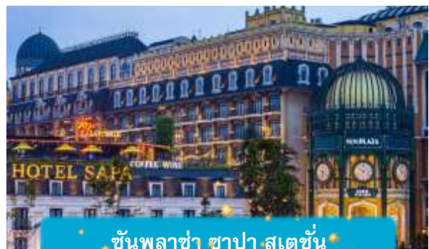
ชั้นพลาซ่า ซาปา สเตชั่น