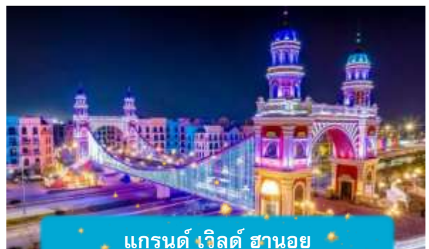
แกรนด์ เวิลด์ ฮานอย