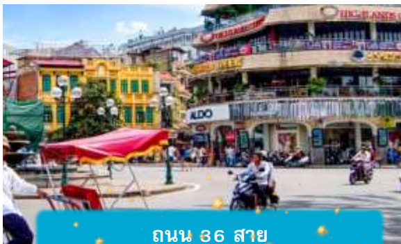
ถนน 36 สาย

21.05 เดินทางถึง สนามบินสุวรรณภูมิ ประเทศไทย โดยสวัสดิภาพ ... พร้อมความประทับใจ