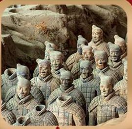
“สุสานจีนซีฮ่องเต้”

ชมถ้ำหลงเหมิน มรดกโลกที่เมืองลั่วหยาง • สุสานจีนซีฮ่องเต้ • ศาลเจ้ากวนอู วัดเส้าหลิน + ป่าเจดีย์ + ชมโชว์กังฟู • เมืองโบราณลั่วหยาง • อุทยานหยุนไท่ซาน เจดีย์ห้าพันปี • ถนนวัฒนธรรมต้ากิง • ถนนคนเดินอิสลาม • จัตุรัสหอรบะซิง