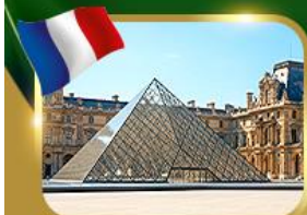
พีพีธกันที่ลูฟวร์ ปารีส