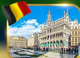
จัตุรัสกรองด์ ปลาซ บรีซเซลส์