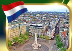
จัตุรัสดันสแควร์ อัมสเตอร์ดัม