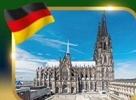
มหาวิหารแห่งเมืองโคโลญ