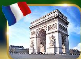
ประตูชัยฝรั่งเศส ปารีส