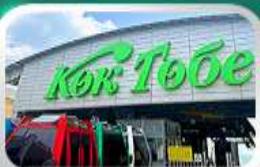
ซิมบูลัค

นั่งกระเช้าซิมบูลัค • ทะเลสาบโคลไซ • โบสถ์เซนต์คอป