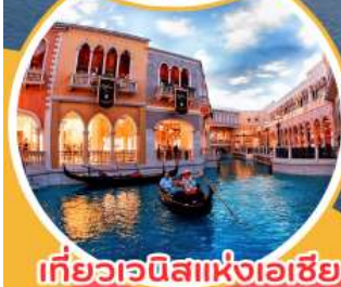
เที่ยวเวนิสแห่งเอเชีย