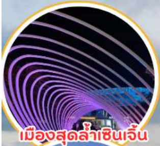
เมืองสุดล้ำเซินเจิ้น

🌐 www.buddytriptravel.com 📱 buddytriptravels 📧 @buddytriptravel