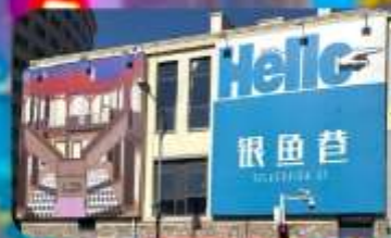
ตรอกซิลเวอร์ฟิช