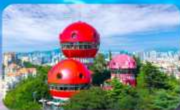
จุดชมวิว SIGNAL HILL