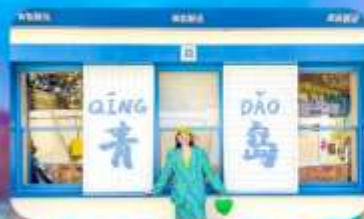
ถนนหลงเจียง