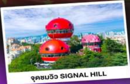
จุดชมวิว SIGNAL HILL