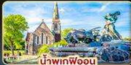
น้ำพุเกฟออน