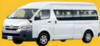
VAN (2-8 ท่าน)