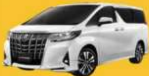
Alphard (2-4 ท่าน)