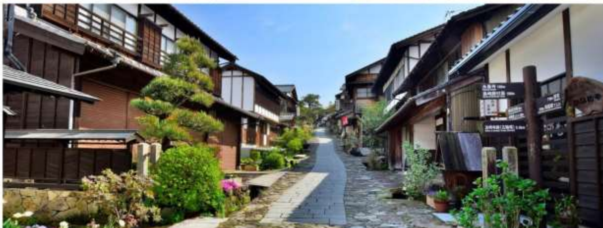
รูปภาพใช้เพื่อประกอบการโฆษณาเท่านั้น