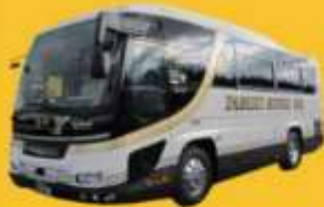
Bus (10-20 ท่าน)

➔ สำหรับท่านที่ต้องการความเป็นส่วนตัวมากขึ้น ท่านสามารถเลือกใช้บริการ รถส่วนตัวได้โดยมีรูปแบบรถให้เลือกถึง 3 ประเภท โดยรถ แต่ละประเภทสามารถนั่งได้ตั้งแต่ 2 ท่านขึ้นไป