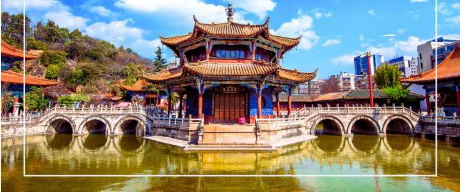
วัดหยวนตง (Yuantong Temple)