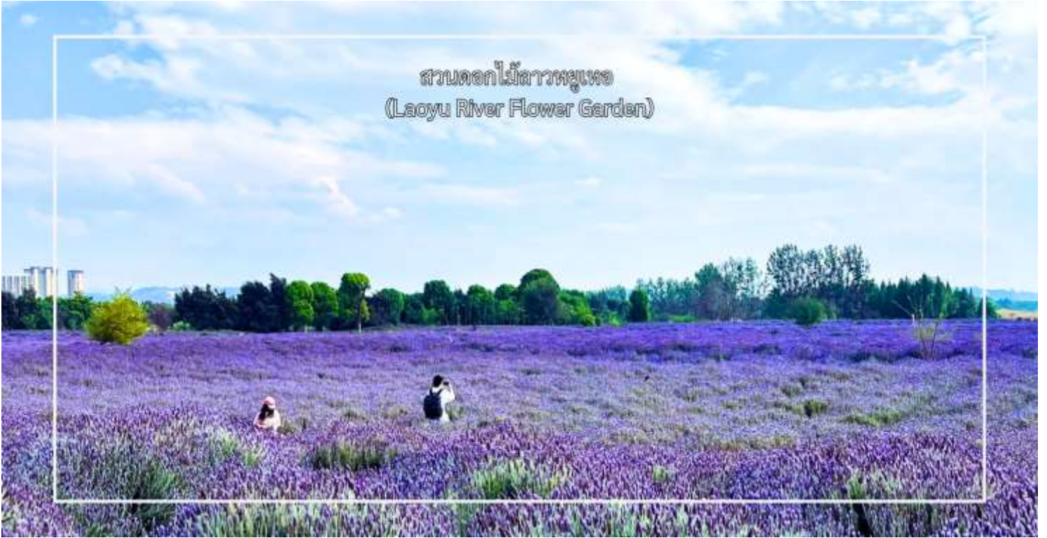
สวนดอกไม้ลาวพวยเพอ (Laoyu River Flower Garden)