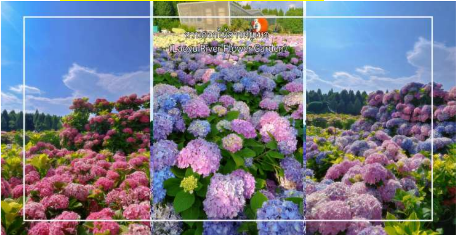
สวนดอกไม้ลาวยูเนอ (Laoyu River Flower Garden)

หมายเหตุ : การออกดอกของดอกไม้ในโปรแกรมท่องเที่ยวอาจแตกต่างกันไปในแต่ละช่วงเวลา ทั้งนี้ขึ้นอยู่กับสภาพอากาศและสภาพภูมิประเทศของพื้นที่ ณ วันเดินทางจริง ดอกไม้อาจยังไม่บานเต็มที่หรืออาจร่วงโรยแล้วทางบริษัทฯ ไม่สามารถการันตีการออกดอกหรือความสวยงามของดอกไม้ได้