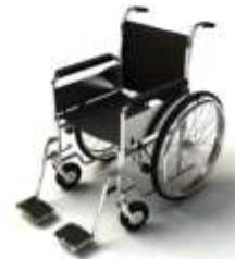
การรับรถเข็นเป็นพิเศษ

กรณีผู้เดินทางต้องการความช่วยเหลือเป็นพิเศษ อาทิเช่น การใช้วีลแชร์ กรุณาแจ้งบริษัทฯ อย่างน้อย 7 วันก่อนการเดินทาง มิฉะนั้นบริษัทฯ จะไม่สามารถจัดการล่วงหน้าได้ เนื่องจากการขอใช้วีลแชร์ในสนามบินนั้น ต้องมีขั้นตอนในการขอล่วงหน้า และบางสายการบินอาจมีการเรียกเก็บค่าใช้จ่ายทั้งทางสนามบินไทยและในต่างประเทศ ซึ่งผู้เดินทางสามารถสอบถามกับเจ้าหน้าที่ได้โดยตรงก่อนทำการจอง และหากในขณะของท่านมีผู้ต้องการดูแลพิเศษ เช่น ผู้ที่นั่งรถเข็น (Wheelchair), เด็ก, ผู้สูงอายุและผู้ที่มีโรคประจำตัวหรือไม่สะดวกในการเดินทางท่องเที่ยวในระยะเวลาเกินกว่า 4 - 5 ชั่วโมงติดต่อกัน ท่านและครอบครัวต้องให้การดูแลสมาชิกภายในครอบครัวของท่านเอง เนื่องจากการเดินทางเป็นหมู่คณะ หัวหน้าทัวร์มีความจำเป็นต้องดูแลคณะทัวร์ทั้งหมด