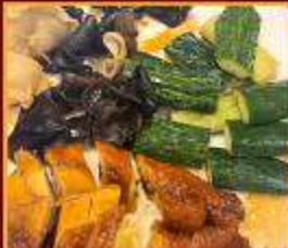
ไก่ แดงกวา เห็ดหูหนู