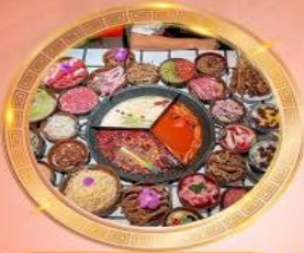
บุฟเฟต์หม้อไฟลงชิง