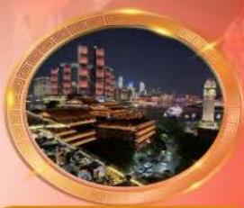
มือค้ำร้านอาหารวิวหลักล้าน