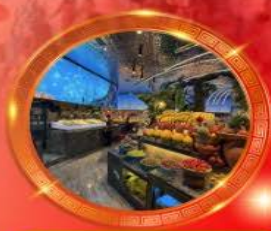
มือพิเศษ บุฟเฟต์นานาชาติ