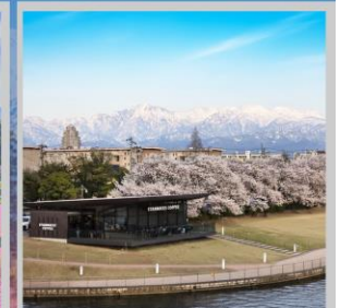
“TOYAMA KANSUI PARK”