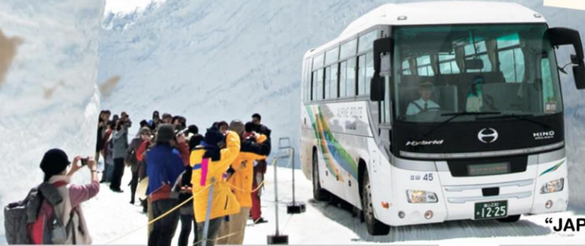
“JAPAN ALPINE ROUTE”