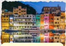
ทะเลสุริยขึ้นฉันทรา