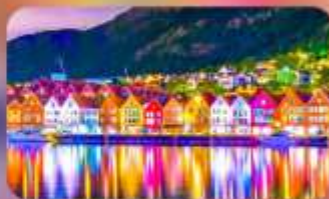
พิกเบอร์เกิน 1 คืน