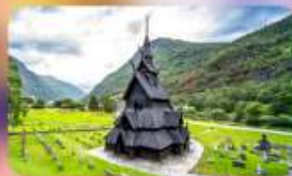
Unseen โบสถ์ Borgund Stave Church