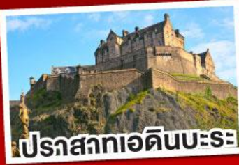
ปราสาทเอ็ดินบะระ