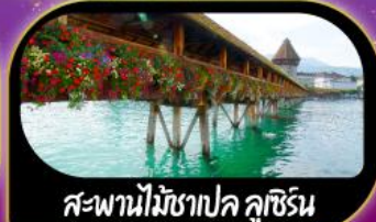
สะพานไม้ฆาปค ลูซิริน