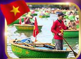
เรือกระด้ง หมู่บ้านกิมกาน