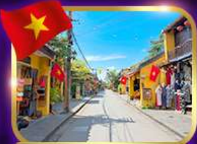
เมืองเก่ามรดกโลก ฮอยอัน