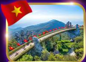
สะพานมือสีทอง บานาฮิลล์