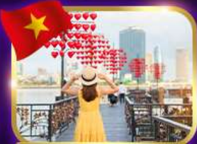
เช็คอินสะพานแห่งความรัก