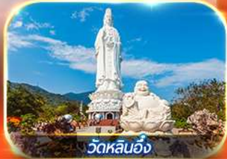
วัดหลินอิ่ง