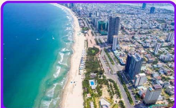
เช็किन ชายหาดหมีเคว เป็นชายหาดที่สวยงามที่สุดในเมืองดานัง