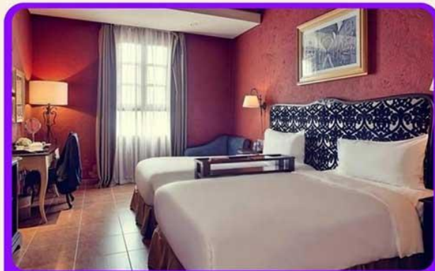
พักบนบานาฮิลล์ 1 คืน