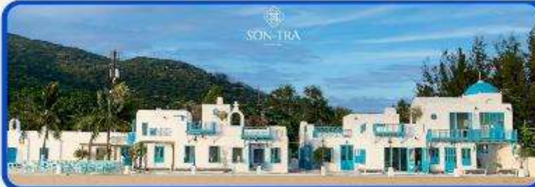
เช็คอินคาเฟ่ SON TRA MARINA