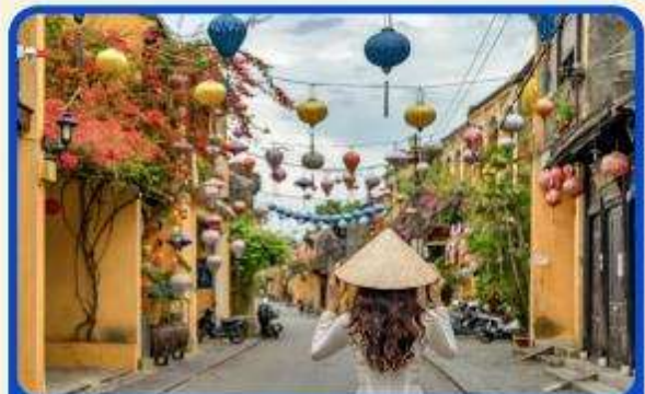
เที่ยวเมืองเก่าฮอยอัน