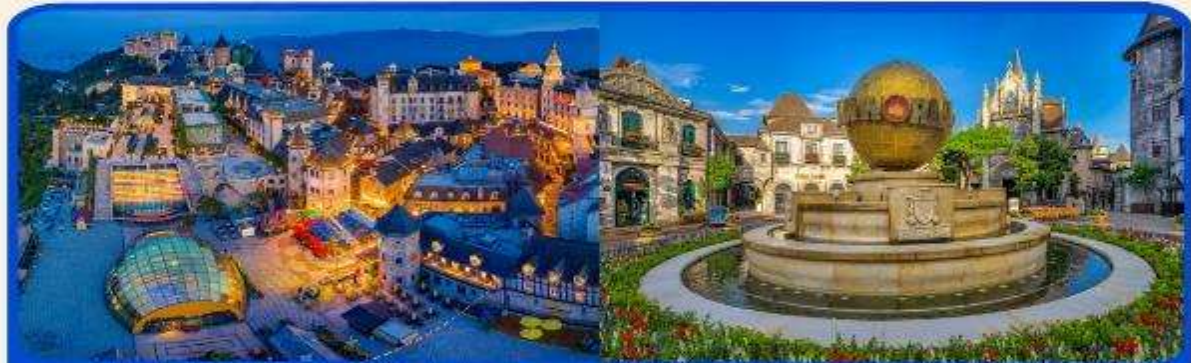
พักผ่อน บานาฮิลล์ 1 คืน