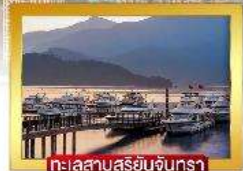
ทะเลสาบสุริยจันทร์