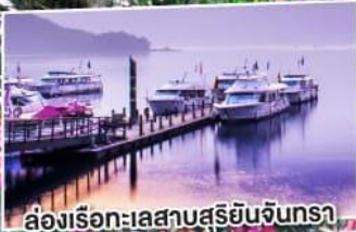
ส่องเรือทะเลสาบสุริยันจันทรา