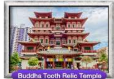
Buddha Tooth Relic Temple