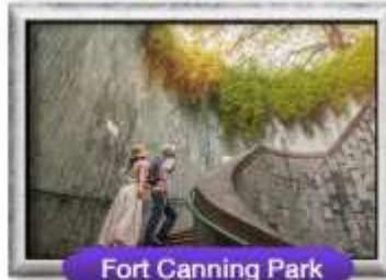
Fort Canning Park