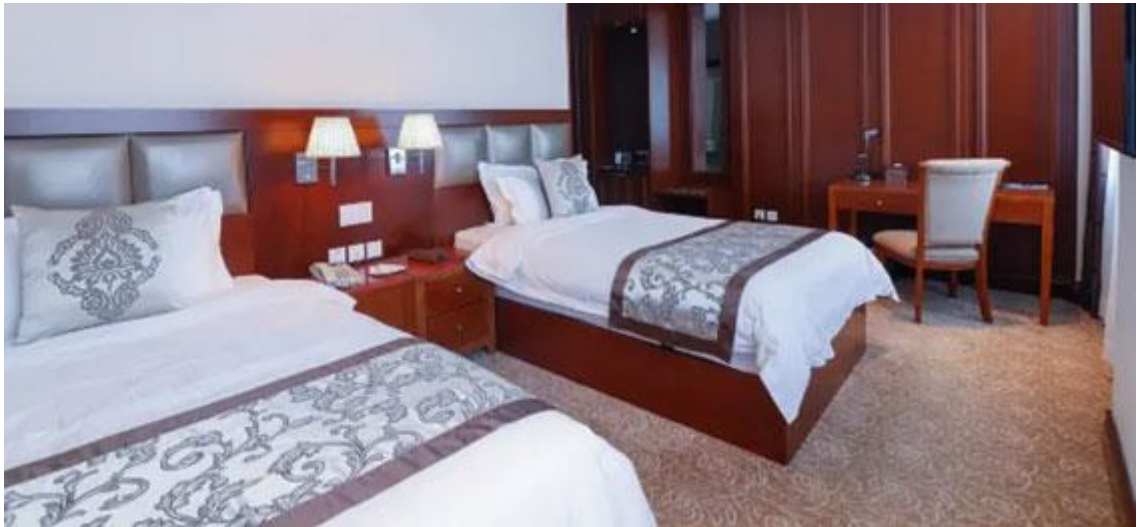
หรือ ที่พัก 4 ดาว Aurora Hotel Ulaanbaatar