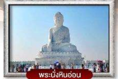
พระนั่งหินอ่อน