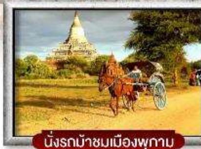
นั่งรถม้าชมเมืองพุกาม