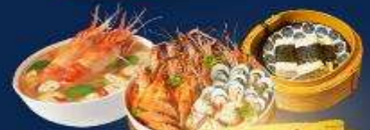
อาหารไทย จีน Seafood

เปิดประสบการณ์นอนนับดาวสุดฟิน กลางทะเลทรายซาฮารา "Luxury Camp"