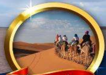
Sahara Desert (Merzouga)