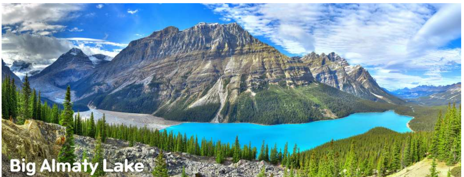
Big Almaty Lake

เช้า รับประทานอาหารเช้า ณ ห้องอาหารโรงแรม