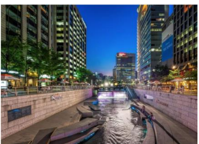
ทางเดินอย่างสวยงาม

ตลาดอาหารควังจั้ง สัมผัสวัฒนธรรมอาหารท้องถิ่นของเกาหลี กำลังเป็นที่นิยมของคนเกาหลี ไคดอล ยูทูบเบอร์ไปถ่ายทำจำนวนมาก มีอาหารสไตล์ท้องถิ่นให้เลือกทานมากมาย ได้บรรยากาศความเป็นเกาหลีที่แท้จริง