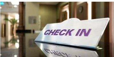
เช็คอินเข้าโรงแรมปูซาน

พาท่านสัมผัสประสบการณ์ใหม่กับการนั่งสกายแคปซูล บนรางรถไฟลอยฟ้า เลียบทะเลแฮอนแด เมืองท่าอันดับ1ของประเทศเกาหลีใต้ ตัวแคปซูลหนึ่งคันจะนั่งได้ 4ท่าน แต่ละแคปซูลก็จะมีสีสันสดใส น้ำเงิน แดง เหลือง เขียว เล่นสลับๆกันไป สีสวยตัดกับท้องฟ้า แล่นคู่ขนานกับรถไฟขมทะเลด้านล่าง ระหว่างนั่งในแคปซูลท่านจะได้ชมวิวเมืองปูซานได้ทั้งซ้ายและขวา แคปซูลจะแล่นช้าๆให้เราไปชื่นชมความงาม ของวิวทะเล และวิวตัวเมือง ถือว่าเป็นที่เที่ยวเปิดใหม่ล่าสุด ที่น่าไปเที่ยวมากๆเลยทีเดียว