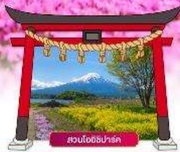
สวนโออิชิปาร์ค