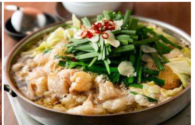
มตสึนาเบะ (Motsunabe)