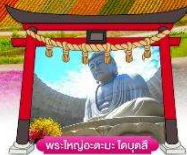
พระใหญ่อะตะมะ โดบุตสึ