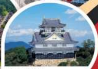
ปราสาทกิฟุ