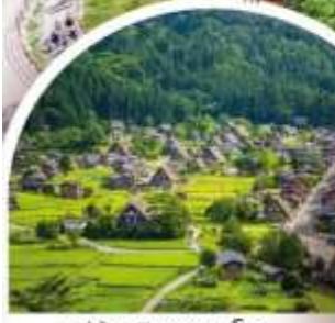
หมู่บ้านฮิราคาว่าโกะ