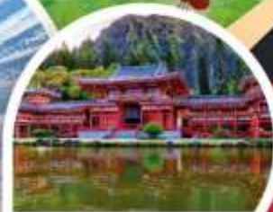
วัดเมียวโดจิน

นาโกย่า ◦ อนุยามะ ◦ ทาคายาม่า ◦ คามิโคชิ ◦ ทาคายาม่า ◦ ลุจิ ◦ โอซาก้า