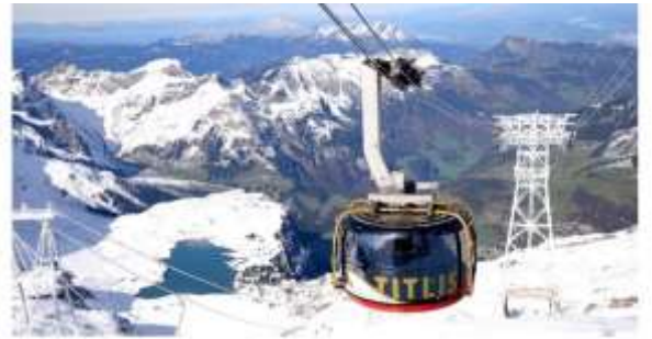
Highlight ! กระเช้าโรตเตอร์เป็นกระเช้าไฟฟ้าหมุนได้ 360 องศาแห่งแรกของโลก จุผู้โดยสารได้ 80 คน ใช้เวลาประมาณ 5 นาทีในการขึ้นสู่ยอดเขา

จากนั้นนำท่านเดินทางสู่ เมืองแองเกิลเบอร์ก (Engelberg) (ระยะทาง 36ก.ม. / 1 ชม.) หมู่บ้านเล็กๆ ตั้งอยู่เชิงเขา ที่ล้อมด้วยเทือกเขาแอลป์ เป็นที่ตั้งของ สถานีขึ้นกิตลิส จากนั้นนำท่านนั่งกระเช้าโรตเตอร์เพื่อเดินทางขึ้นสู่ ยอดเขากิตลิส (Titlis) (ค่าขึ้นกระเช้าไป-กลับ รวมในค่าทัวร์แล้ว) ให้ท่านจะได้สัมผัสกับกระเช้าทรงกลมที่เรียกว่า โรตเตอร์ เคเบิลคาร์ ในขณะที่เคลื่อนที่ขึ้นไปเรื่อยๆ ท่านจะเห็น เทือกเขาแอลป์ ธารน้ำแข็ง และทะเลสาบเบื้องล่าง ในวันที่อากาศแจ่มใส คุณสามารถมองเห็นยอดเขา Jungfrau joch และ Eiger ได้อีกด้วย