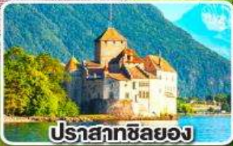
ปราสาทชิลยอง