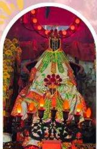
วัดเจ้าแม่กวนอิมอ่องฮำ ขอพรเรื่องเงิน ทรัพย์สิน และความมั่งคั่ง