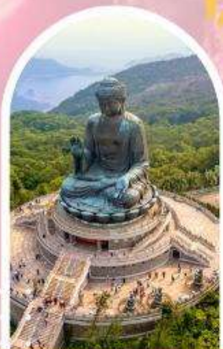
นั่งกระเชานองปิง นมัสการพระใหญ่ไปหกลิน