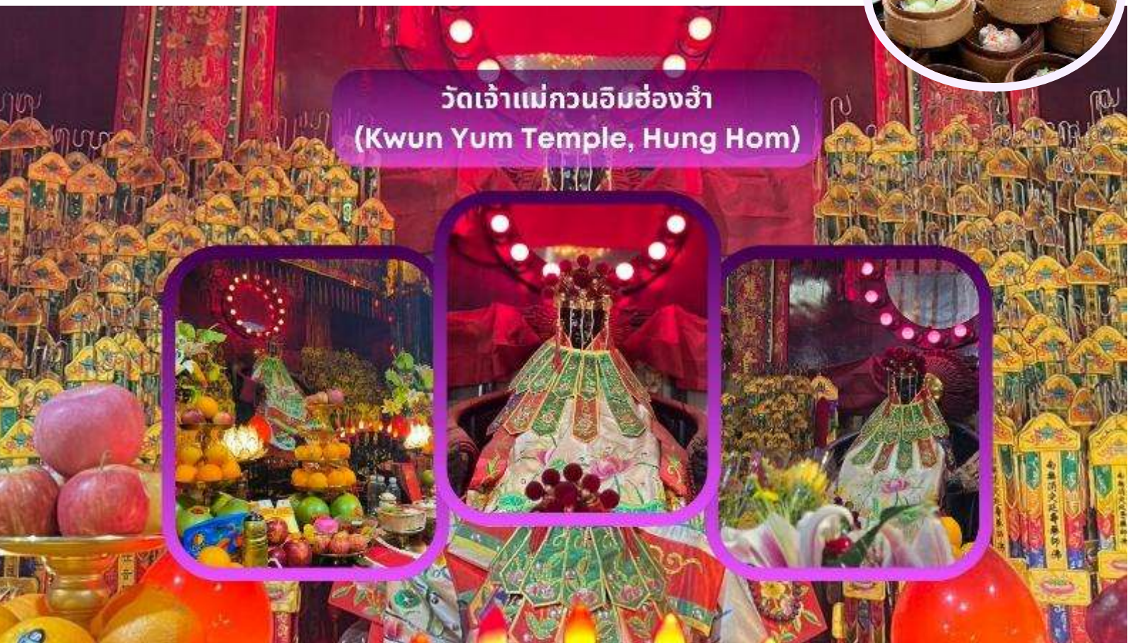
วัดเจ้าแม่กวนอิมฮ่องกง (Kwun Yum Temple, Hung Hom)