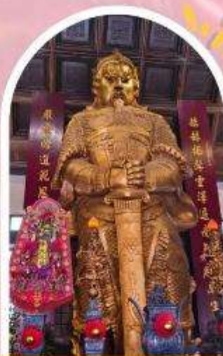
วัดแซกง ขอพรโชคลาก การเงิน และธุรกิจ