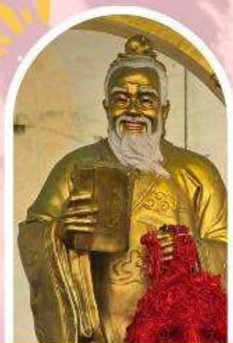
วัดหวังต้าเซียน ขอพรสุขภาพ ความรัก