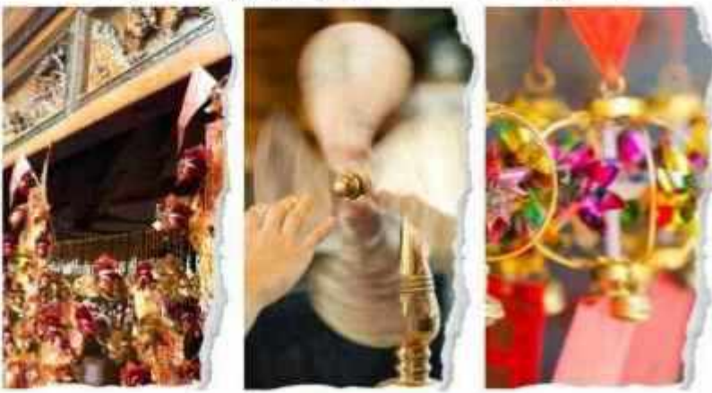
วัดเชกงหวีว

นำท่านขอพรเพื่อเป็นสิริมงคล วัดแห่งนี้เป็นวัดที่คนฮ่องกงให้การเคารพนับถือเป็นอย่างมาก เป็นวัดเก่าแก่และมีชื่อเสียงที่สุดวัดหนึ่งของฮ่องกง เป็น 1 ในวัดของฮ่องกงที่ทุกท่านห้ามพลาดเลยก็เดียว